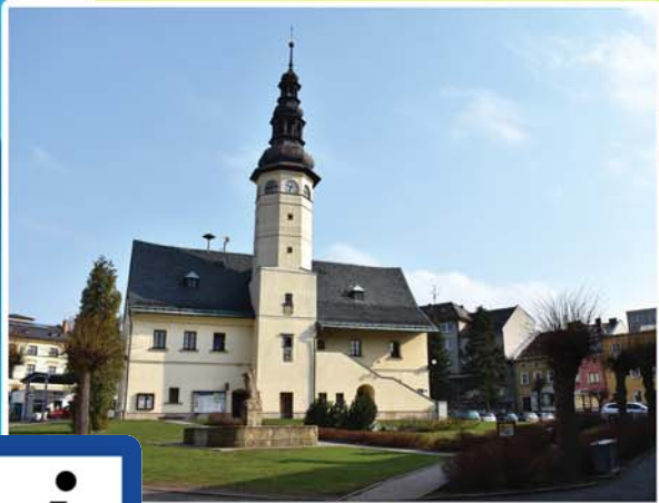
RATUSZ/RADNICE, STARÉ MĚSTO