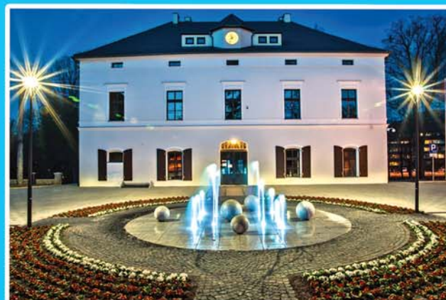
URZĄD MIEJSKI/MESTSKÝ ÚRAD, STRONIE ŚLĄSKIE

Centrum Edukacji, Turystyki i Kultury Kościuszki 18, Stronie Śląskie (+48) 74 814 32 05 www.cetik.stronie.pl , www.stronie.pl pn. – pt./ Po – Pá 8:00-18:00 sob./ So 9:00-13:00