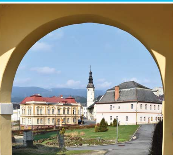
WIDOK Z BRAMY KOŚCIELNEJ/ POHLED OD KOSTELNÍ BRÁNY, STARÉ MĚSTO

nám. Osvobození 166, Staré Město (+420) 583 239 134, www.staremesto.info pn. – pt./ Po – Pá 8:00 – 12:00; 12:30 – 17:00 sob./ So 8:00 – 12:00; 12:30 – 17:00 niedz./Ne 8:00 – 13:30