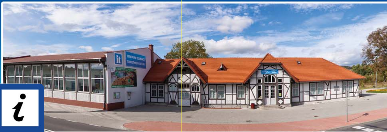
CETIK, STRONIE ŚLĄSKIE

Centrum Edukacji, Turystyki i Kultury Kościuszki 18, Stronie Śląskie (+48) 74 814 32 05 www.cetik.stronie.pl , www.stronie.pl pn. – pt./ Po – Pá 8:00-18:00 sob./ So 9:00-13:00